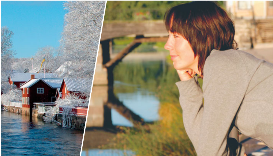
Exempel 1: En stor huvudbild till höger med en mindre kompletterande bild till vänster.