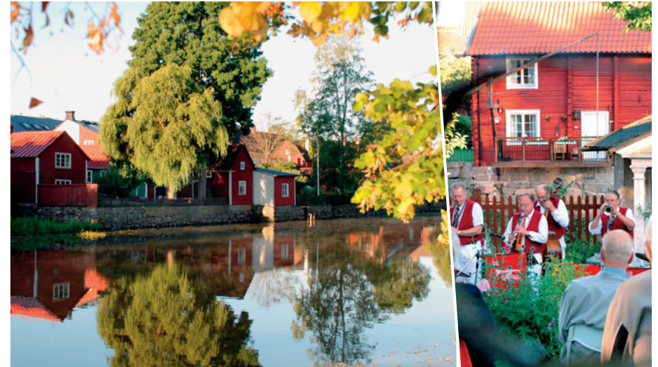
Exempel 2: En stor huvudbild till vänster med en mindre kompletterande bild till höger.